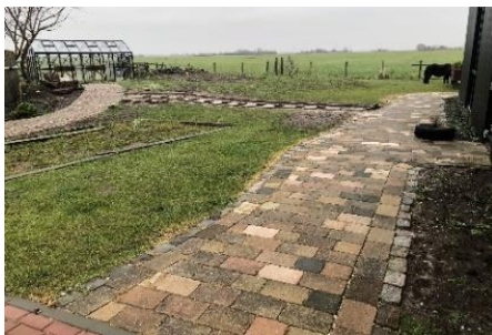
Terrein achter gebouwen eind 2024