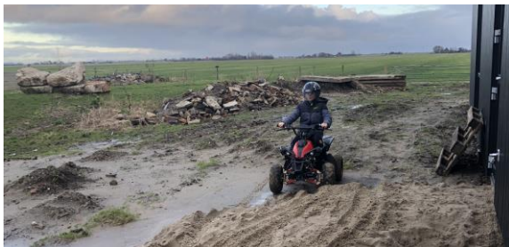
Terrein achter gebouwen begin 2024