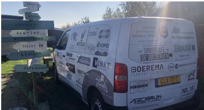
De nieuwe bus die wij mogen gebruiken dankzij veel sponsoren