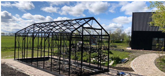
De nieuwe tuinkas in aanbouw